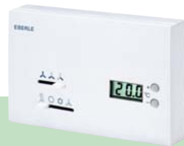
KLR-E 527 24