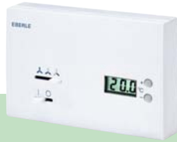
KLR-E 527 23